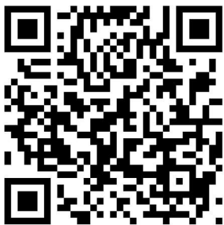
SV Pang 1950 e.V. Abteilung Bogensport

Die Bogenschützen des SV Pang freuen sich auf Euren Besuch, wünschen eine gute Anreise und "Alle ins Gold"